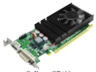
GeForce GT430 グラフィックス・カード