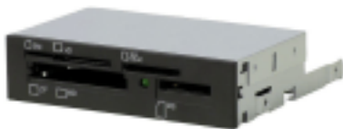
3.5"ベイ USB接続メディアリーダ FA406(B)