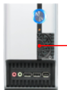
フロントI/Oポート ※ HDD冷却ファン内蔵

さらに、リアパネルに2ポートのリンク速度5GbpsのUSB 3.0 ポート (2) 、8ポート(2ポートはフロントパネル上)のUSB 2.0ポート、フロントパネルとリアパネルにFirewire (IEEE1394a) ポートを装備するなど、優れた機能拡張性を備えています。