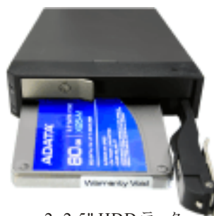
2x2.5" HDD ラック Insta STOR IS12TB