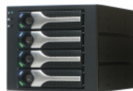
Enhance S34T 3.5" x4 リムーバブルHDDベイ

Qualest™ C357WS1シリーズは、無駄な発熱を抑えてシステム消費電力を低減する 80Plus 高効率電源を装備しています。システムからの発熱量に応じて回転数が3段階に選べる 12cm ファンや、オプションの HDD冷却用の温度可変速ファン を採用して、システムの動作音を低減しています。