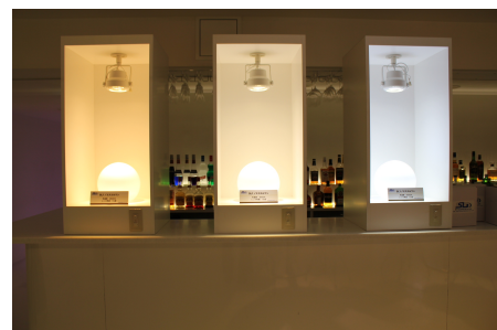
無段階調光スポットライト「SL1」