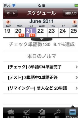
(学習スケジュール管理)