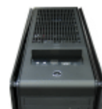
12cm冷却ファン内蔵天板