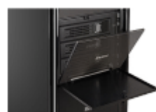
3.5インチx3 リムーバブルHDDベイ