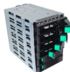
3.5インチx6 リムーバブルHDDベイ

Qualest™ C357WS4シリーズは、RAID 0, 1, 5 & 10をサポートするIntel® マトリックス・ストレージに対応した、2ポートの6Gbps SATAポートと4ポートの3Gbps SATAポートを装備しています。さらに、RAID 0, 1をサポートしたMarvell® 88SE9128チップ2個による、6Gbps SATAポートとeSATAポートを各2ポート装備しており、強力なストレージ環境とデータ・バックアップ機能を提供します。ペリフェラル・インターフェイスとして、6ポートの5Gbps USB3.0/2.0ポート、4ポート (2ポートはフロント・パネル) のUSB2.0/1.1ポート、2ポートのeSATA/USB Combo ポート、2ポートのIEEE1394a FireWireポートを装備しており、データのバックアップにも活用できます。