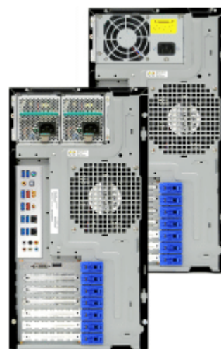
リダンダント電源仕様

Qualest™ C357WS4シリーズは、無駄な発熱を抑えてシステム消費電力を低減する高効率PFC電源を装備しています。システムからの発熱量に応じて回転数が変化する3台のPWMファン (2*12cm & 9cm) と、システム内の発熱部位から放出される熱を効果的に排出するエア・シュロードを採用して、動作音を低減しています。