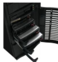
ホットスワップHDDベイ

Qualest™ XE3SV2Lxシリーズは、 80Plus 高効率電源を使用して無駄な発熱を抑え、システムの消費電力を低減しています。また、 12cm システム冷却ファンや 9cm HDD冷却ファン、CPU冷却ファンにシステムからの発熱量に応じて回転数をコントロールする PWM(Pulse Width Modulation) 方式ファンを使用し、温度可変速ファンの使用により 25dB (5) 動作音を達成した静かな電源を使用して、システムの静音性を向上しています。