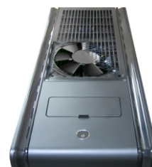
筐体上部排気ファン