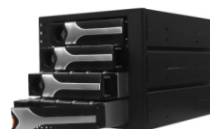
S34T リムーバブル・ベイ