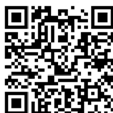
『ゲムッパ』アクセス用QRコード