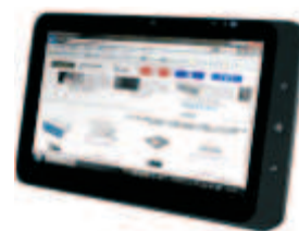
静電容量方式 タッチパネル