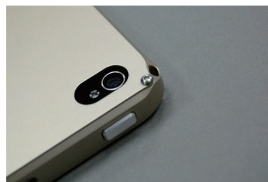
カメラ,ON/OFFスイッチ,ストラップ部