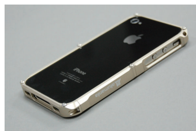
バックパネルを取り外した使用