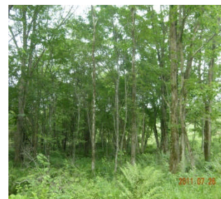
広葉樹と針葉樹の森林