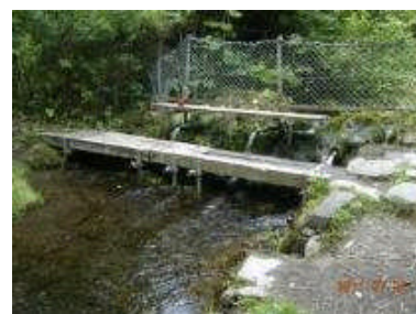
森林がはぐくむ豊富な水資源