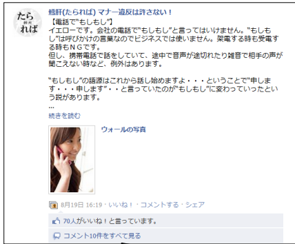
電話の「もしもし」の語源や用法についての投稿