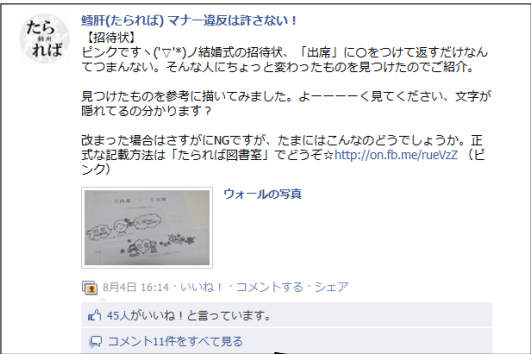
結婚式の招待状の返信での「遊び心」