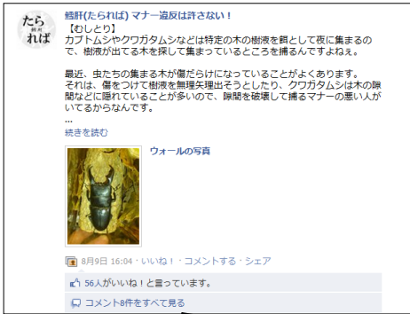
夏の定番「むしとり」でのマナーって？