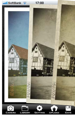
3. 経年劣化がアニメーションで再現されます!!

仮想撮影日の設定は撮影後に何度でも変更できますので、お好みのレトロ写真を楽しく作成することが可能です。