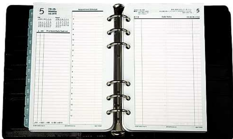
コンパクトサイズ/日本製版

オンライン・ショッピングでは、現在早期予約キャンペーン実施中です。(11 月 6 日まで) http://www.franklinplanner.co.jp/shopping/index.html