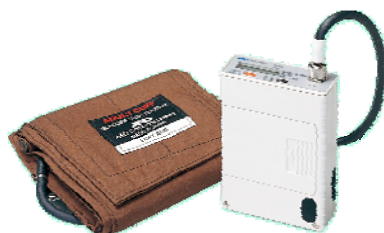
携帯型自動血圧計 TM-2431 医療機器承認番号:21000BZZ00455000 JAN コード:4981046700399 標準価格：¥250,000（税込価格¥262,500）