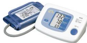
通信機能付血圧計 UA-767PC 医療機器認証番号:219AHBZX00019000 JAN コード:4981046027625 標準価格：¥15,000（税込価格¥15,750）