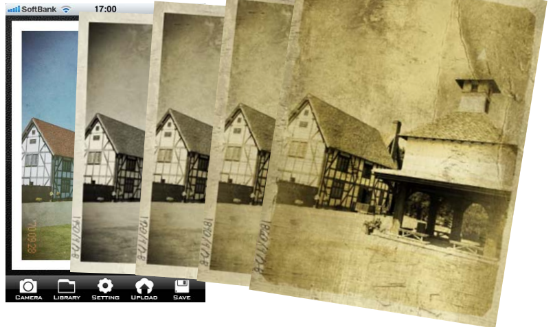
3. 経年劣化がアニメーションで再現されます!!

仮想撮影日の設定は撮影後に何度も変更できますので、お好みのレトロ写真を楽しく作成することが可能です。