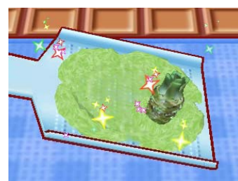
▲わさびをおろしている所です。