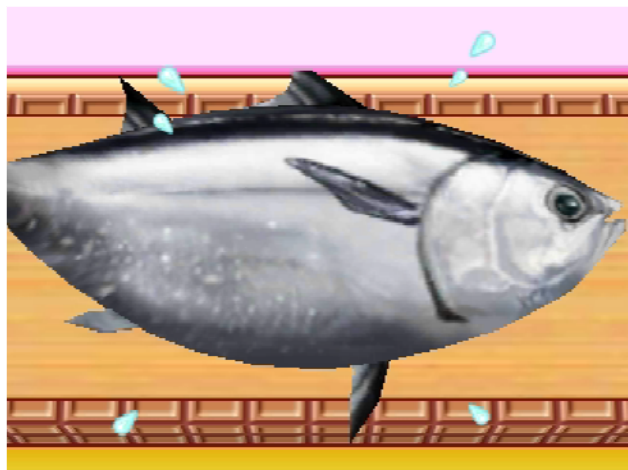
▲「おすし」では迫力のマグロをカイタイします。

さらには、お子様の探究心をくすぐり、食育にも触れられるシリーズの最新作「クッキングママ4」