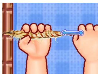
▲エビに串をさしています。