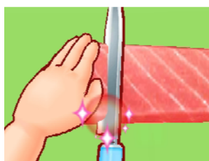
▲食材はお料理に至るまで全てリアルに描かれており、お子様にも理解しやすくなっています。