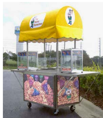
1坪ビジネスが可能な販売ワゴン 高さ:2520mm 横幅:1280mm(最大2500mm) 奥行:850mm

株式会社ナッティー・ババリアン・ジャパンでは、加盟店を募集しています。 詳しくはHP http://nuttyb.jp/index.html をご覧ください。