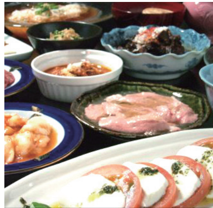
選べる生絞りドリンク各種 女性のための美肌ホルモンダイニング