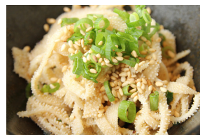
こだわり白センマイ刺し