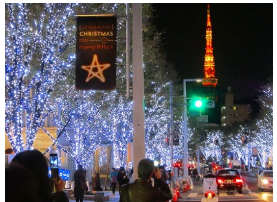
六本木でイルミネーション散歩を楽しむ人々。 『おさんぽマイスター』では現在、イルミネーションさんぽ特集を開催中です。