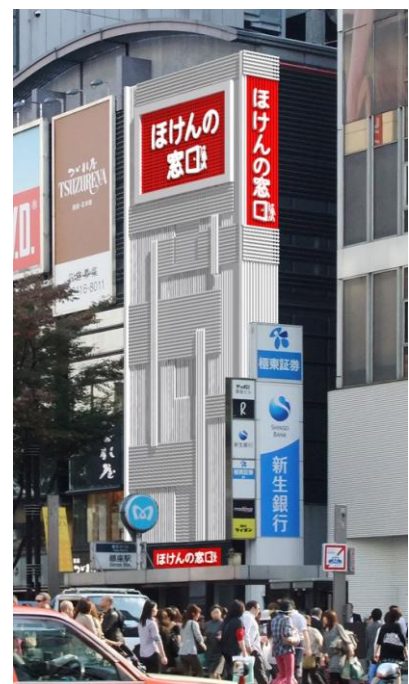
【ビル外観イメージ】