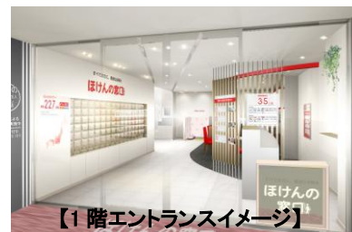
【1 階エントランスイメージ】

白を基調とした、落ち着きと開放感のあるエントランスに、4 つのブースを構えます。（キッズスペース・ベビーベッド完備）