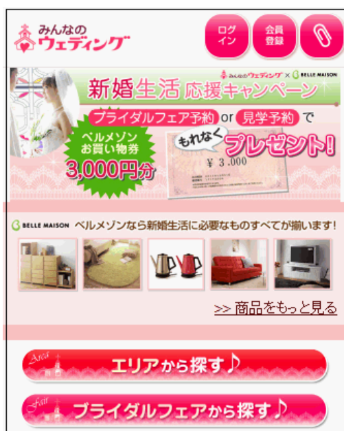
スマートフォン TOP イメージ