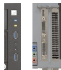
左 フロントコネクタ&スイッチ 右 2スロットグラフィックス・ボード装着例