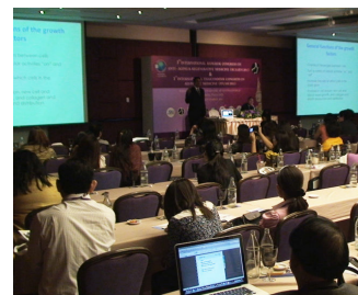
国際アンチエイジングシンポジウムの様子

2011 年 9 月にはタイ・バンコクで行われた「第 3 回・国際アンチエイジングシンポジウム（国際アンチ・エイジングと再生医療医学会）」にチェアマン（座長）として出席、学術発表を行ったほか、同年 11 月にはイギリス・ロンドン（Skin Geeks 社主催）で、“幹細胞およびグロースファクター（細胞成長因子）の化粧品への応用、その未来”と題したセミナーを開催、また日本へも定期的に訪れ、セミナーを開催するなど、世界各国でグロースファクター治療の普及を促す活動を精力的に行っている。