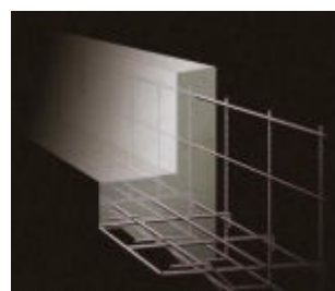
スラブシステム基礎

＜QUAD（クアド）＞は木造軸組工法で主要な柱である通し柱に国産無垢の檜4寸（12cm 角）柱を使用、また木造軸組の垂直面（壁）に耐力面材、水平面（床）に床版を施工する「フレーミングモノコック工法」で耐震性を高めています。基礎は城南建設標準仕様の「スラブシステム基礎（ベタ基礎、コンクリート厚：150mm 鉄筋：13mm）」で堅固な「構造」としています。