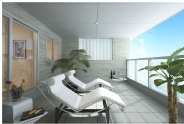
バスルームから連続するインナーバルコニー