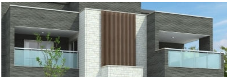
バルコニーシースルーパネル、スクリーンルーバー

外壁材に高品質でデザイン性の高い「16mm サイディング」を採用、外観デザインを引き立てるアイテムとして、意匠性が高く開放的な「バルコニーシースルーパネル」やデザイン性と機能性を兼ね備えた「スクリーンルーバー」を標準仕様とし、スタイリッシュな「外観」としています。