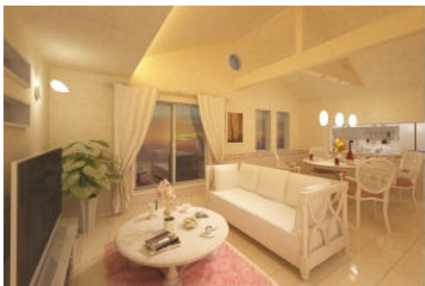
勾配天井のあるリビングダイニング (エレガンス)

吹抜けのあるパブリック空間を実現する「シースルー階段」や居室に広がりをもたらす「勾配天井」を標準仕様とし開放感のある「住空間」を演出します。また居室との連続空間でゆとりある暮らしを実現する「インナーバルコニー」や書斎、家事室、パントリー等「自由空間／収納空間」のプランを提案しています。