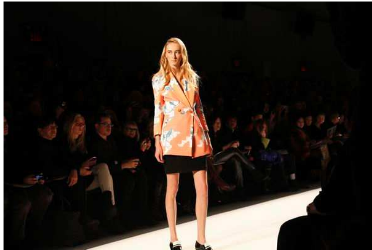
満席の会場。立ち見も満員でした。