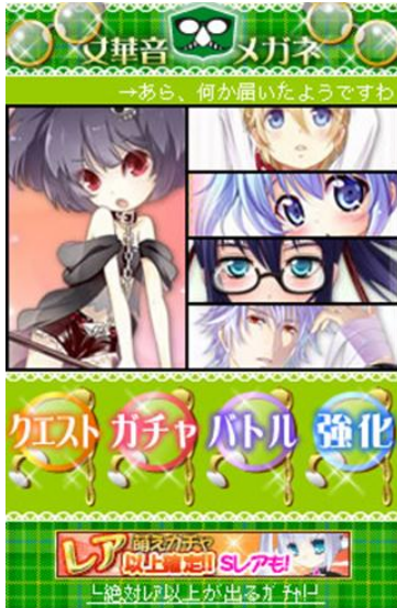
【女華音(メガネ)属性】

各属性の嗜好に合わせて、最適なデザインのマイページをご用意いたしました！プレイヤーは、自分の好きな属性をとことんまで味わう事ができます。