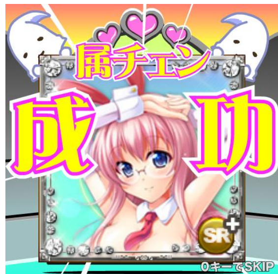
女華音(メガネ)属性に属チェン成功！