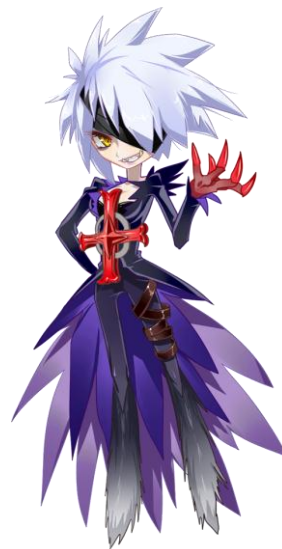
【千憂似(チュウ)ノ神】