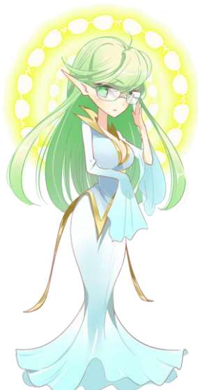
【女華音(メカネ)ノ神】

荒廃から立ち直りつつある世界で、自分が唯一信じる『萌え』を「女華音(メカネ)」「露梨(ロリ)」「千憂似(チュウ)」の中から選択し、それぞれの属性を司る神に任じられた愛の伝道師として、プレイヤーは「クエスト」を実行して世界を巡ります。クエストを進行する中で、共に伝道に協力する「親衛隊」が集まっています。集まった親衛隊を「強化」していき、自分の信じる属性愛で世界を埋め尽くしましょう！