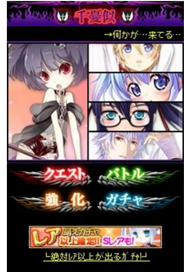
【千憂似(ちゅに)属性】