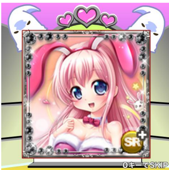
露梨(り)属性の親衛隊が…

プレイ中、自分の愛する属性とは異なる属性の親衛隊が加わる事があります。そういう場合は、「属性チェンジ」を行うことで、親衛隊を自分の属性色に染め上げる事ができます！