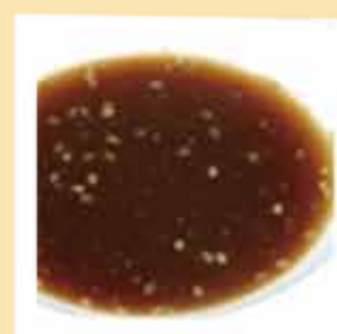
オリジナル バーベキューのたれ