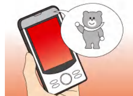
キャラクター等を利用したスマート フォンアプリケーション