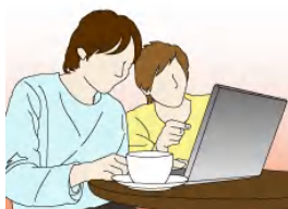
声優、タレント等著名な方の声でのWEB キャンペーン等の音声合成サービス