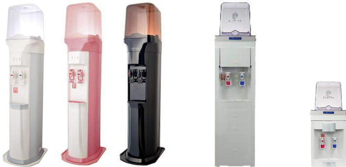
床置きタイプ(スリム)