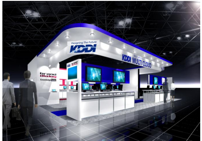
出展ブースイメージ

詳しくはこちら: http://gridy.jp/knowledgesuite/event/cce12_s.html