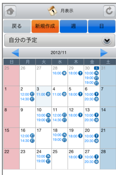
&lt;スケジュール画面&gt;