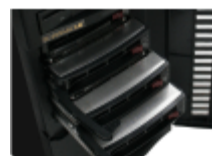
ホットスワップベイ