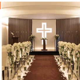
アン ウェディング ウィズ (AN WEDDING WITH)