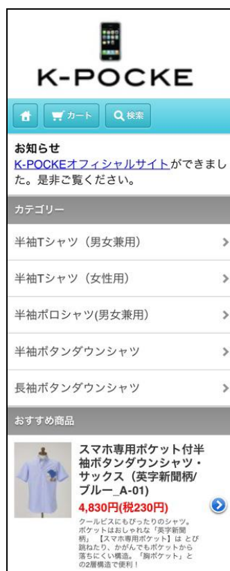
ケーポケショップ(スマホ版) 画面イメージ