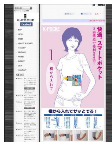
ケーポケ公式サイト(PC版) 画面イメージ