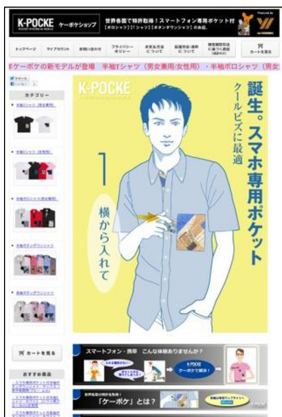
ケーポケショップ(PC版) 画面イメージ

また「ケーポケショップ」の開店に加え、ケーポケ公式サイト( http://www.k-pocke.com/ )も開設いたしました。公式サイトでは動画や開発秘話などを紹介し、販売サイトよりさらに詳しい情報を発信して参ります。