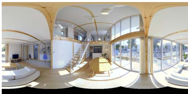
建物内のバーチャルツアー（パノラマ画像）

当キャンペーンでは、6月15日より無印良品有楽町店、丸井吉祥寺店にて巨大 AR パネルを設置し、店頭で iPhone を使い、無印良品の家を体験することができます。iPhone アプリからは、パノラマ写真で内部の様子がリアルにわかる「バーチャルツアー （注2） 」も連携して見ることができ、どんな家に住めるのか、実際の家の様子を疑似体験することができます。