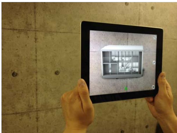
iPhone アプリで3DCG の「無印良品の家」を疑似体験

今回のキャンペーンは、2年間無料で家具付きの「無印良品の家」に住む体験ユーザーを募集する、という企画で、当社は株式会社良品計画の「顧客に体験を提供したい」という趣旨に沿った形で、実際に住む家の疑似体験（レビュー）ができる AR （注1） 機能を搭載した iPhone アプリの企画開発を担当いたしました。