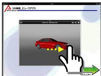
連続イメージ表示