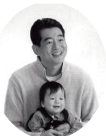
山田正人 前横浜市副市長