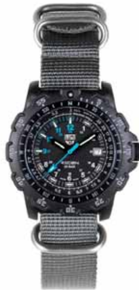
8820 FORCE RECON/YEL (イエロー)

【ルミノックス・ライト・テクノロジー】1-8 時・時 分針：レッド/9-12 時・ 秒針・ベゼル：イエロー