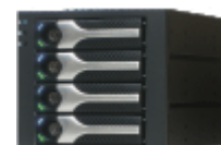
4x 3.5" HDDベイ