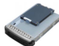
2.5" HDD/SSD 変換トレイ