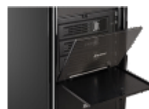
3.5インチx3 リムーバブルHDDベイ