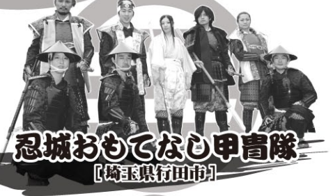
忍城おもてなし甲冑隊 【埼玉県行田市】