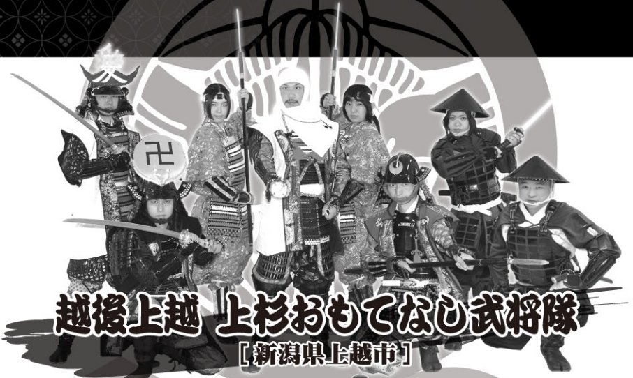
越後上越 上杉おもてなし武将隊 【新潟県上越市】