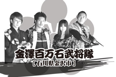
金澤百万石武将隊 【石川県金沢市】