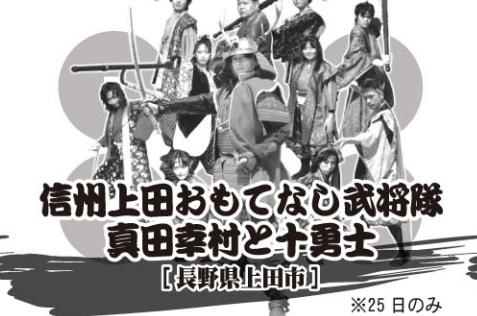
信州上田おもてなし武将隊 真田幸村と十勇士 【長野県上田市】