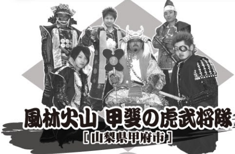
風林火山 甲斐の虎武将隊 【山梨県甲府市】