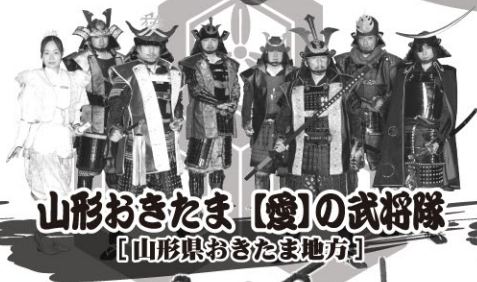
山形おきたま【燧】の武将隊 【山形県おきたま地方】