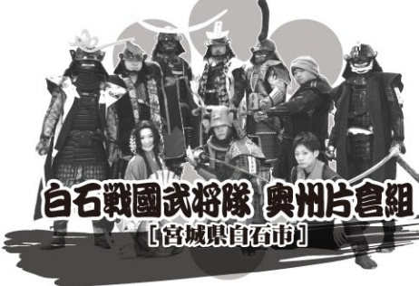
白石戦国武将隊 奥州片倉組 【宮城県白石市】