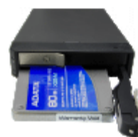
2x2.5" HDD ラック