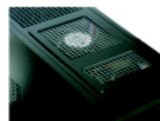
システム静音ファン