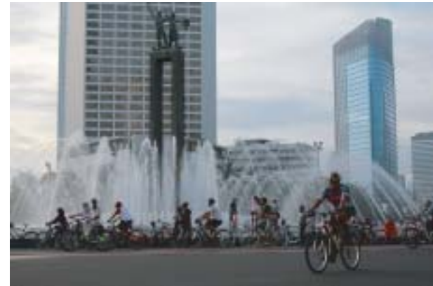
Jakarta Cycle Event in JAK Japan Matsuri Sep.30 2012