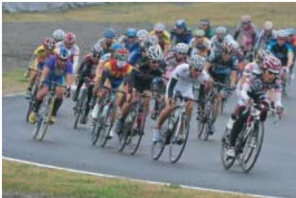
Indonesia Cycle Enduro in Sentul International Circuit Sep.29 2012