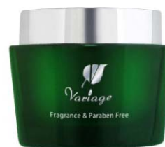
ヴァリアージュ クリーム 6,090円（税込） 30g

「Variage（ヴァリアージュ）」は、長年 女性のお肌の悩みを研究してきた当社の独自技術を生かし、小じわやハリ、弾力など、年齢肌の悩みをケアするために誕生した、新しいエイジングスキンケアシリーズです。