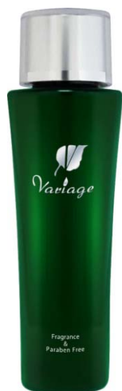
ヴァリアージュ ローション 5,040円（税込） 120ml

化粧品を製造販売する株式会社 天真堂（本社：東京都江東区、代表取締役 児玉 和之）では、乾燥による小じわに対する効果が認められた※1、エイジングスキンケアシリーズ「Variage（ヴァリアージュ）」を、2012年9月3日（月）よりWEBサイトにて発売いたします。