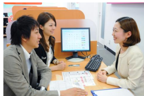
【ライフパートナー(店頭営業)による無料相談会イメージ】

当社は2000年3月、横浜港北ニュータウンに日本初の『生損保乗り合いの来店型保険ショップ』を開業し、“訪問販売”が主流であった業界に革命を起こしました。「中立的な立場の保険の専門家が、無料でお客様のライフプランをしっかりとヒアリングし、約35社の商品の中からお客様に合った保険を提案する」というスタイルが好評を博し、2012年8月28日現在、全国296店舗、年間12万件以上の新規のお客様にご利用をいただいておりますが、9月1日に全国300店舗目をオープンすることになりました。