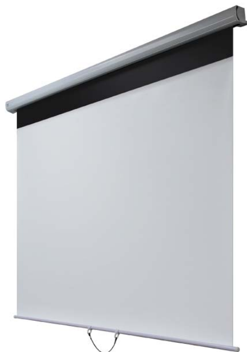
写真：WSM-068F-FV1（スライドレールのないタイプ）