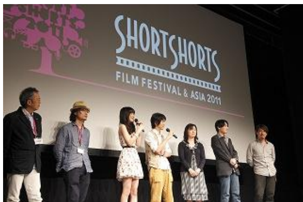
SSFF & ASIA 2011きりゅうプログラムでは 桐生舞台の制作作品を特集上映