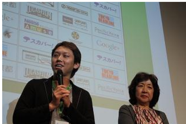
SSFF & ASIA 2012 ジャパン部門にて 桐生舞台の制作作品をプレミア公開