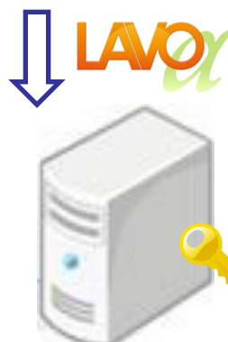
御社決済サーバー